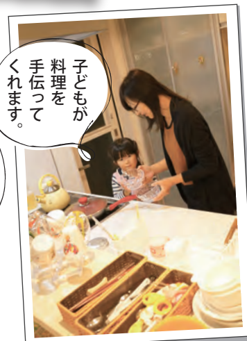
子どもが料理を手伝ってくれます。