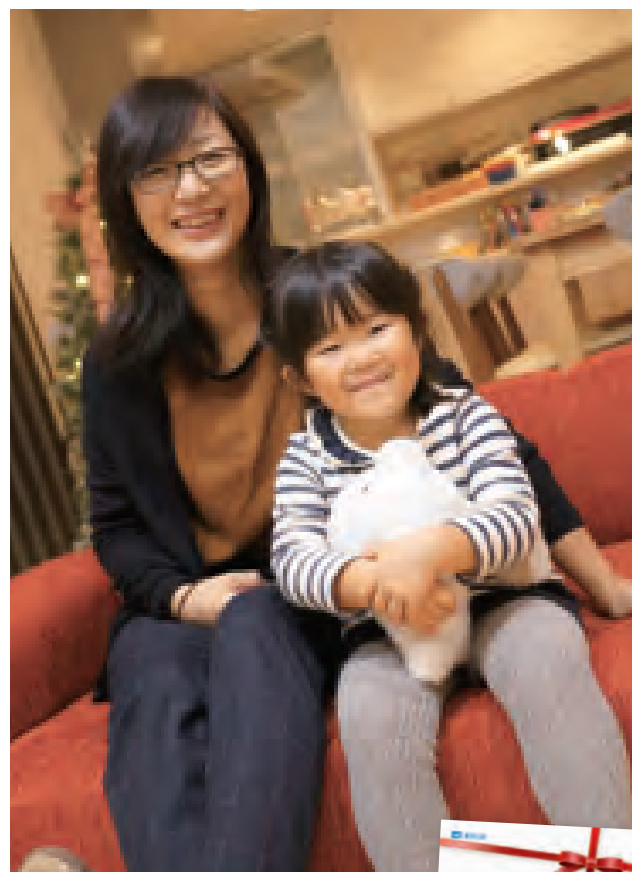
「働くお母さんに贈る家」本を見て建てたら洗濯作業が本当に1/10になった！

キラ伊だった家事 …洗濯干し、しま、食器洗い、お風呂洗い、全部笑！ 今はラク！ —アパート生活と比べてどうですか？ とにかく家事が時短できるおかげで、子どもと向き合う時間を捻出できてます！ —家事がどう楽になりましたか？ 以前は、洗濯機→ハンダに干す→取り 「洗濯する→歩いて3歩のところに干す」