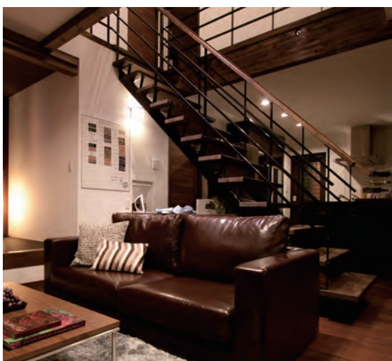
好みのインテリア