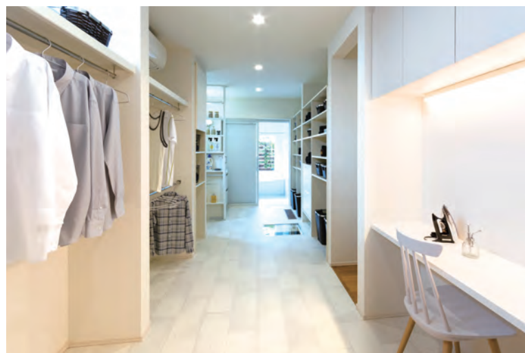
家事 1/2 造り付け家具付き